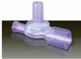
ダブルチェックバルブ Value DCV シリーズ

ダブルチェックバルブ DCV シリーズは、二重に配置されたチェック弁によって液体を外気に曝すことなく移送するシステムです。各接続ポートはルアー・フィッティング用ターミネーションが標準となっています。