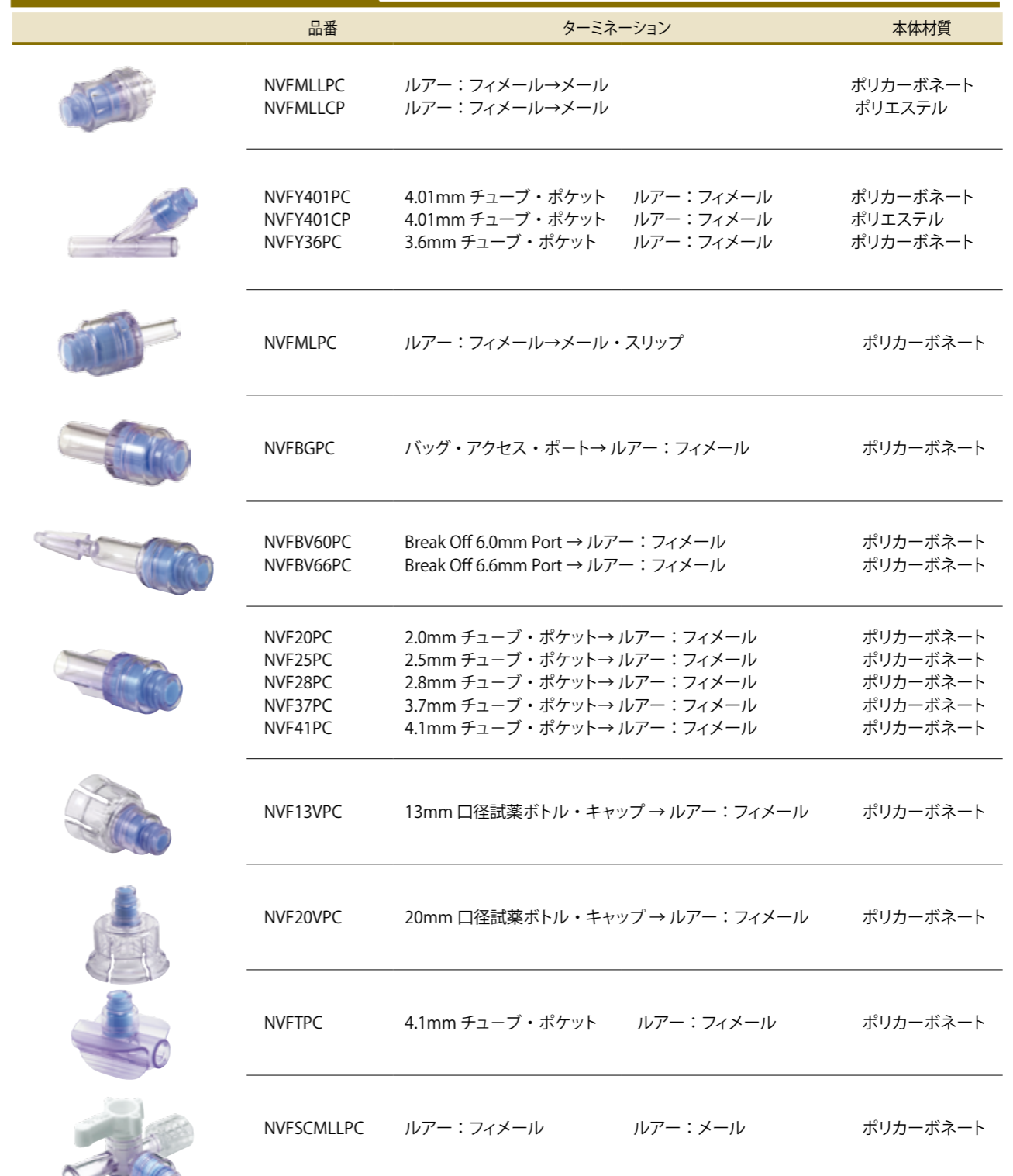
スワバブル・バルブ

ルアー用シャット・オフ・バルブ スワバブル・バルブ ルアー・フィッティングと併せて使用することで簡易的なシャット・オフ・バルブとしての役割をはたす超小型バルブです。シリコーン製のバルブは、非接続時の混入リスクを軽減するためノーマル・クローズが標準となっています。また、ガンマ線や EtO による殺菌にも可能です。