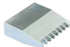
フラット・ノズル

注意：製品の性能は、圧力、温度、薬品、使用環境などによって影響を受けることがあります。お客様のご使用環境でこの製品が適しているか否かは、お客様ご自身でお確かめください。