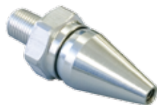
ジェット・ノズル